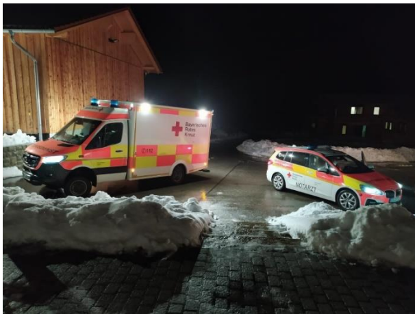
Rettungsdienstinsatz der UGRD mit Notarzt 2022

Das Wichtigste zuerst: Wenn sich eine Person in einer akuten Notlage befindet, wähle die 112 um die Notrufzentrale zu erreichen und einen Notruf abzusetzen. Durch präzises Nachfragen der Leitstelle werden notwendige Daten wie Name, Adresse und Zustand so schnell wie möglich erfasst. Bereits während des Notrufs wird die nächstgelegene Rettungswache gesucht. Über den Pager, einen „Piepser“, empfängt die BRK-Bereitschaft Viechtach eine Meldung über drei Zeilen mit den wichtigsten Informationen, anhand dessen auch darüber entschieden wird, ob der Rettungsassistent die Unterstützung des Notarztes benötigt. Bei Ankunft hat die Versorgung des Patienten natürlich Priorität, jedoch achten die Einsatzkräfte auch auf einen beruhigenden und vertraulichen Umgang mit den Geschädigten. Stets wird einem erklärt, welche Maßnahmen getroffen werden. Nachdem der Patient erstversorgt und stabil ist, wird er auf dem schnellsten Weg Richtung Arberland-Klinik Viechtach transportiert. Bereits von den Rettungssanitätern angemeldet, kann der Patient sofort in den richtigen Raum zur perfekten Versorgung gebracht werden. Die BRK-Bereitschaft hat ihre Aufgabe bestens erfüllt!