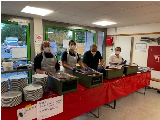
Verpflegungseinsatz bei der Flutkatastrophe in Ahrweiler, 2021

Der Helfer vor Ort (HvO) Zellertal kommt immer dann zum Einsatz, wenn die ehrenamtlichen Helfer den Notfallort schneller erreichen können als der Rettungsdienst. Die Ehrenamtlichen übernehmen die Versorgung des Patienten bis der Rettungsdienst eintrifft.