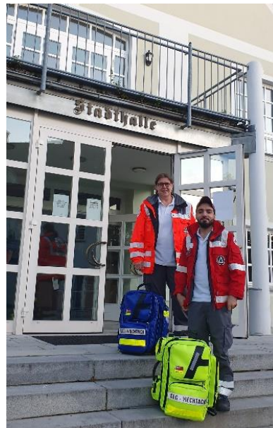
Sanitätsdienst beim Volksfest in Viechtach und bei einer Veranstaltung in der Stadthalle